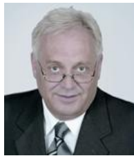
Peter Sönnichsen Kreispräsident des Kreises Plön und Schirmherr des EhrenamtForums im Kreis Plön

Das EhrenamtForum 2011 im Kreis Plön wird organisiert durch den Kreisjugendring Plön e.V. und als Fortbildungsveranstaltung gefördert durch Mittel des Kreises Plön bzw. des Landes Schleswig-Holstein.